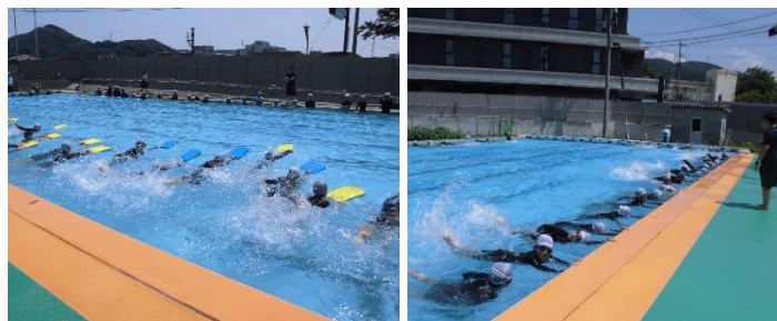
6年生水泳の授業の様子

水泳では、様々な泳法を身に付けることも大切ですが、水の事故を防ぐために安全に気を付けて授業を行って行きます。