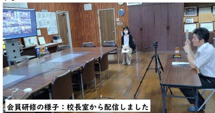
会員研修の様子：校長室から配信しました

子供たちが安心安全に夏休みを過ごせるよう、学校でも各地区から出された課題の解決に努めていきます。各地区でも見守りをよろしく願います。