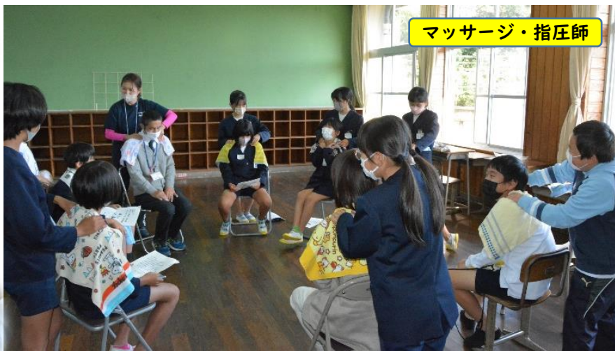
マッサージ・指圧師