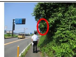
学校で作成した資料