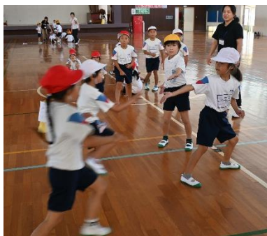
5年生と1年生のリレーの練習の様子です。運動会当日に向け、バトンパスに磨きをかけていきます。