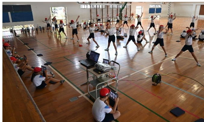
4年生のダンス「ソーラン節」の練習の様子です。タブレットで互いに撮影して動きを確認しています。