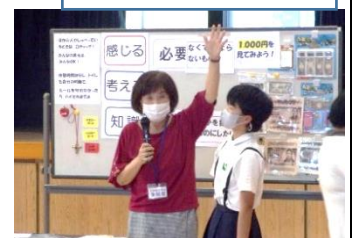
消費者教室の様子↓

5・6年生を対象に消費者教育事業がありました。現在の1時間の労働賃金のことや賢い消費者になるための基本的なことを実感として学べるように工夫して教えて下さいました。現代はクレジットカードで簡単に物が買える時代です。だからこそお金の使い方を正しく学ぶ必要があると改めて思いました。1円玉1000個はどれくらいの長さになるか、児童と背比べをする場面もありました。講師の先生方は5・6年生の話の聞き方や学ぶ姿勢をほめておられました。ぜひ賢い消費者(大人)になって、和水の未来を担ってほしいですね。