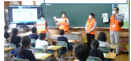
人権擁護委員の皆様↓

人権擁護委員さんと NTT ドコモの協力により「携帯・スマホ教室」を開いていただきました。スマートフォンが子どもたちの生活に大きく関わってきた現代です。便利だけれども、使い方を間違えると大きなトラブルに発展してしまう恐れもあります。責任をもって、賢く使うためのよい学びの機会となりました。