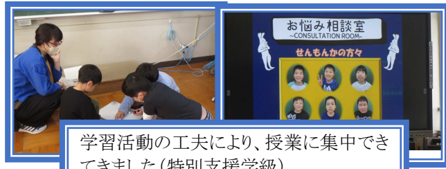
学習活動の工夫により、授業に集中できてきました(特別支援学級)