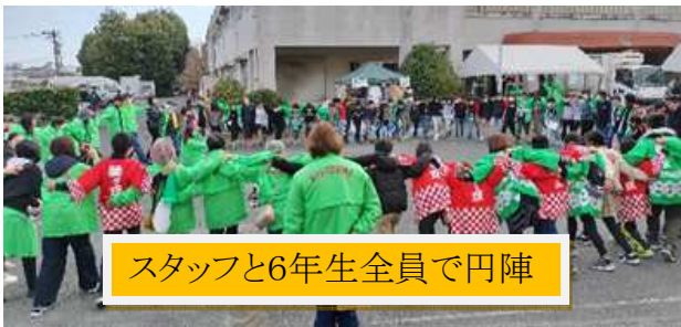
スタッフと6年生全員で円陣

6年生の児童も、地域の一員として、ボランティアで前日の準備をし、当日も4つのブースでおまつりを盛り上げました。