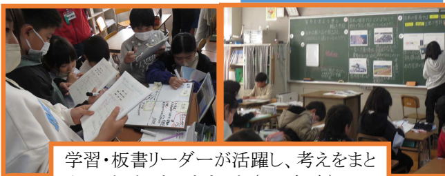
学習・板書リーダーが活躍し、考えをまとめることができてきました(5・6年生)