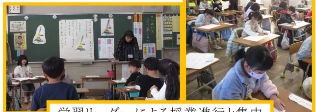
学習リーダーによる授業進行と集中する学習ができてきました(1・2年生)

本校では、「緑ヶ丘ベーシック」という授業スタイルで、みんなで作る授業を目指しています。