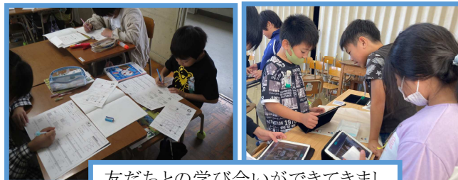
友だちとの学び合いができてきました(3・4年生)