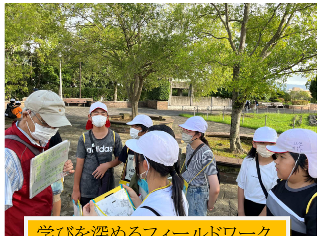
学びを深めるフィールドワーク

修学旅行では、フィールドワークを行い、平和についての学びを更に深めてきました。また、ハウステンボスでは、班での自由行動もあり、思い出深い、修学旅行になったようです。笑顔が輝いた2日間でした。