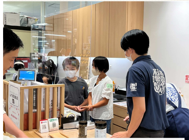
山下鹿造商店での体験