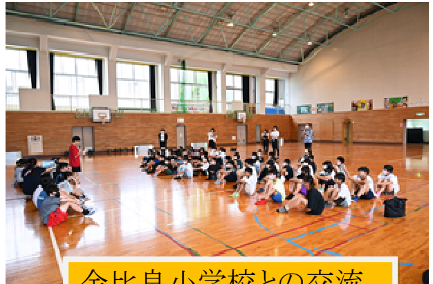
金比良小学校との交流

金比良小学校は、昨年本校と同様、地域と一体となり児童の育成を行っていることを評価され、学校運営協議会が文部科学大臣表彰を受けた学校です。今回の交流を通して、児童は、荒尾の魅力を確認するとともに、金比良小学校の皆さんと友好の輪を広げることができました。この取り組みについては、11月18日(土)「荒尾市教育フォーラム」の中で発表することになっています。是非ご参加ください。