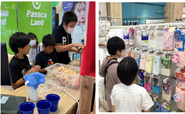
パスカ・生活雑貨での体験

PTA役員さんはじめ、保護者の皆様、ゆめタウンの皆様、地域の皆様、ご協力いただき、ありがとうございました。