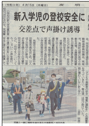
4月15日付:有明新報掲載記事

緑ヶ丘小学校は、スクールバスが運行されています。行きは、福祉センター出発ですが、帰りは、倉掛中、深瀬、古庄原、オの木の順に子供たちは下車します。ゴルフ場そばは、人気も少なく怖いなあと感じました。また、途中、道が狭い上に車の通りが多いところもあり、スクールバスがあることでお家の方は、安心だと話されていました。