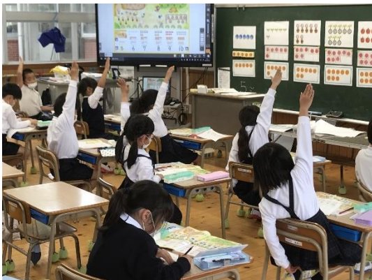
入学間もない1年生

毎月、15日は「学校に行こう会」の日です。次回は、6月15日(水)です。授業は廊下越しになりますが、子どもたちの頑張る姿や学校の環境などをご覧いただければ幸いです。お待ちしております。