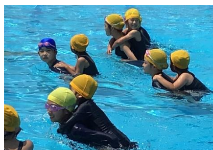
1・6年合同プール開き