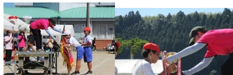
今年度優勝 白団 準優勝 紅団