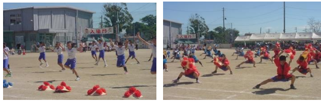
3・4年表現「百華百彩 花笠音頭2025」