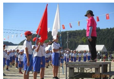
紅白団長選手宣誓