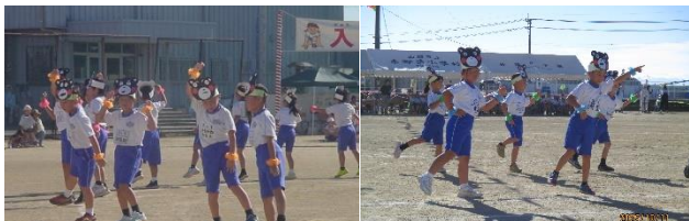
1・2年表現「めのっこサプライズ!」