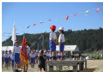
1年生代表開会あいさつ