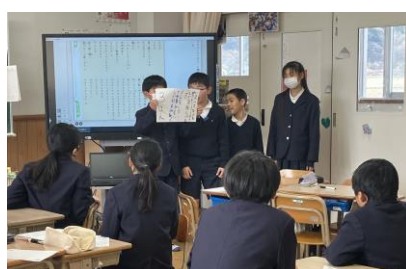
人の話をしっかり聞く姿