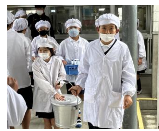
支え合い、協力する姿