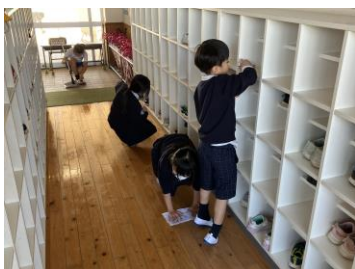
見えない所でも頑張る姿

3学期も、子どもたちの良さを伸ばし、よりよい経験がたくさんできるよう職員一丸で頑張りますので、皆様のご支援をよろしく申し上げます。