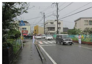
引き渡し・引き取り訓練