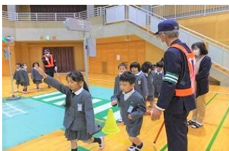
交通安全教室1・2年

地域学校協働活動の一つとして、交通安全協会松高支部の皆様には、様々な活動において「子どもたちの安全のために」ご協力いただいています。4月の入学式、交通安全教室、避難訓練(引き渡し・引き取り訓練)等、お手伝いしていただきました。皆さんも交通ルールをきちんと守ってください。m(_ _)m