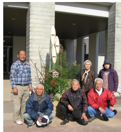
福田地区老人会の方々

年末、福田地区の老人会の方々に、門松を作っていただきました。児童昇降口に飾っています。本校の校舎の外観によくマッチしており、2メートルを超える大きさと、熊本城クラスの立派な門松です。竹や松、南天などの材料は、校区の里山のものをご準備いただき、老人会の方々の手作りの門松で、職員はもちろん、子供たちも大変喜んでいました。初めて、門松を見た子や名前を知った子、製作の様子を見学した子もいて、大変貴重な学習の機会になりました。今週13日まで飾らせていただく予定です。関係者の皆様にご心より感謝申し上げます。