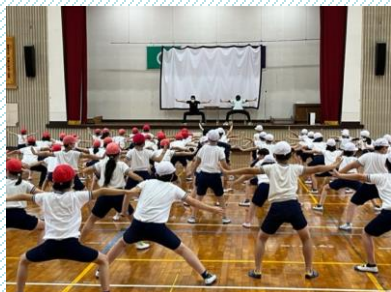
3, 4年生よさこいソーラン