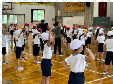
1, 2年生リズムダンス

今月28日(土)に開催予定の運動会。GW明けから、各学年での練習が始まっています。