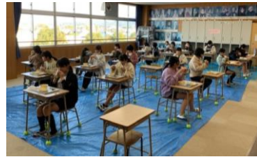
各学年特別教室等を使って分散給食を実施