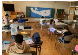
学習ルームと教室に分かれて図工の作業(1年生)

工作・体験活動 熊本の歴史 熊本城バーチャル修学旅行・バスケットボールに挑戦・理科実験など