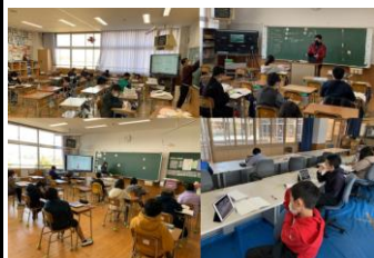
学年を4か所に分けて校内オンラインも活用(6年生)