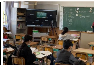
自宅待機が必要な子供たちはZoomで配信