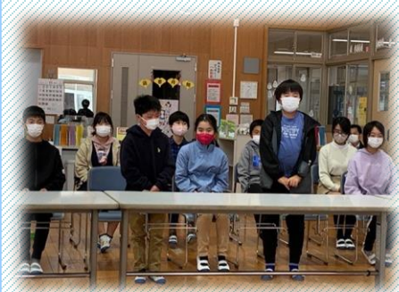
委員の前で提案をする中央企画委員長と飼育栽培委員長