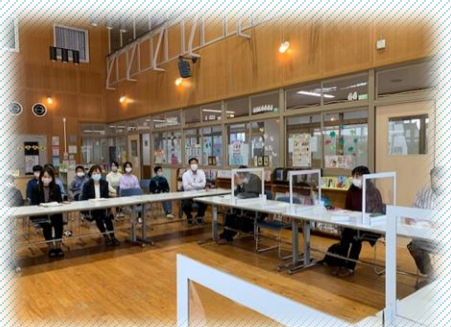
5月、8月に引き続き第3回目は図書室で子供も同席しての開催