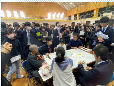
公開学校運営協議会の様子