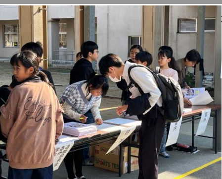
200名以上の受付も6年生が引き受けてくれました

先週の水曜日に、玉名荒尾地区教育委員会連絡協議会及び荒尾市教育委員会指定の研究発表会を開催しました。 予定よりも参加者が増え、総勢240名を超える方に参加していただきました。 授業は、 1年2組国語科、4年1組学級活動、5年1組算数科、ひまわり学級自立活動 を学年の実態に応じた“あらおベーシック”の学習スタイルで、子供たちが主体となって進める様子を見ていただきました。荒尾市が推進する“あらおベーシック”は、教師が一方的に教えたり、一部の子供たちが授業を行ったりするのではなく、全ての子供たちが仲間と一緒に学んで学び合い、自分たちで授業を創っていくという学習スタイルです。 また、授業の後は体育館で、第4回目となる学校運営協議会を公開しました。今後、万田校区が元気になるためのアイデアを大人と子供と一緒に考える異年齢交流の話し合いを行いました。