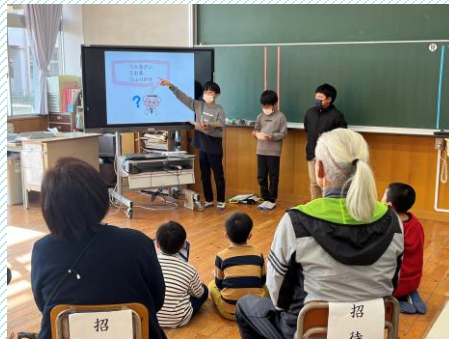
ひまわり学級 自立活動の様子