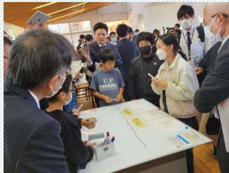
5年1組 算数科の様子