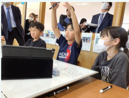
4年1組 学級活動の様子