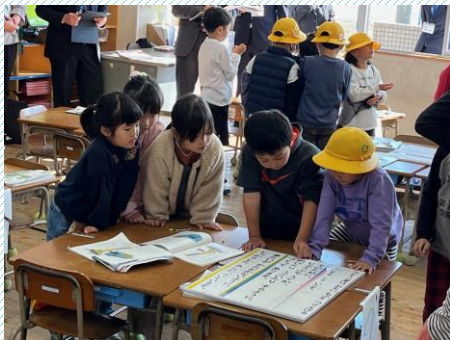
1年2組 国語科の様子