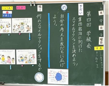
写真② スマイルアクションを全員で決める