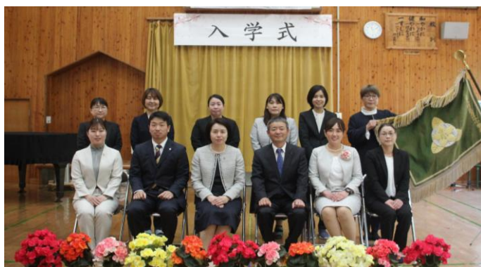
職員5人が新たにチーム入りしました

新たに2人の新1年生が入学し、今年度は、児童27人、職員12人でスタートしました。「1日1ミリ成長するチーム万江小」を目指します。学校教育目標は、「自ら進んで学習する」、「協働して学び合う」ことを重視して新たに設定しました。どの道に進んでも子どもたちが社会の担い手となる20年後に子どもたちの夢が花開くことを願って設定しました。