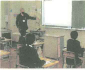
【5年:玉名ブランドの学習】

5年生からは「玉名市の特産物を玉名ブランドとして全国に広く紹介されていることが分かりました。」などの感想が出されました。