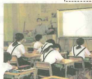
【6年:戦争についての出前授業】

たくさんの写真とわかりやすいお話で防災について子供たちはたくさん学びました。情報を確かめること、日頃からの交流・つながりなど大切にしてほしいです。