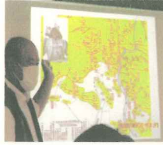
【6年:干拓についての学習】

6年生は横島町文化財保存顕彰会の方達から、岱明や横島の干拓について学習しました。