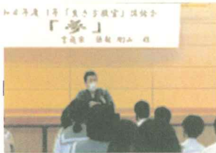
【1年:生き方教室2,3年職業講話】

推進員のコーディネートのもと、地域の方と一緒に校舎玄関前のロータリーの花壇に花苗を植えました。地域の方は早めに来校され、花壇を耕して肥料を入れるなどの準備をしていただき、植え方を教わりながら作業しました。交流する姿がほほえましく、心なごむ活動となりました。