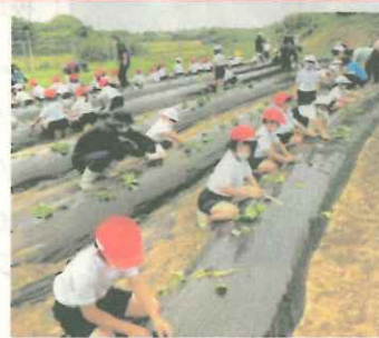
【1,2年:さつま芋の苗の植え付け】

自分が住んでいる地域の祭りのことを学び、知ることができたのは、貴重な体験と知識となりました。