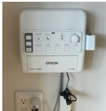
プロジェクター 接続器