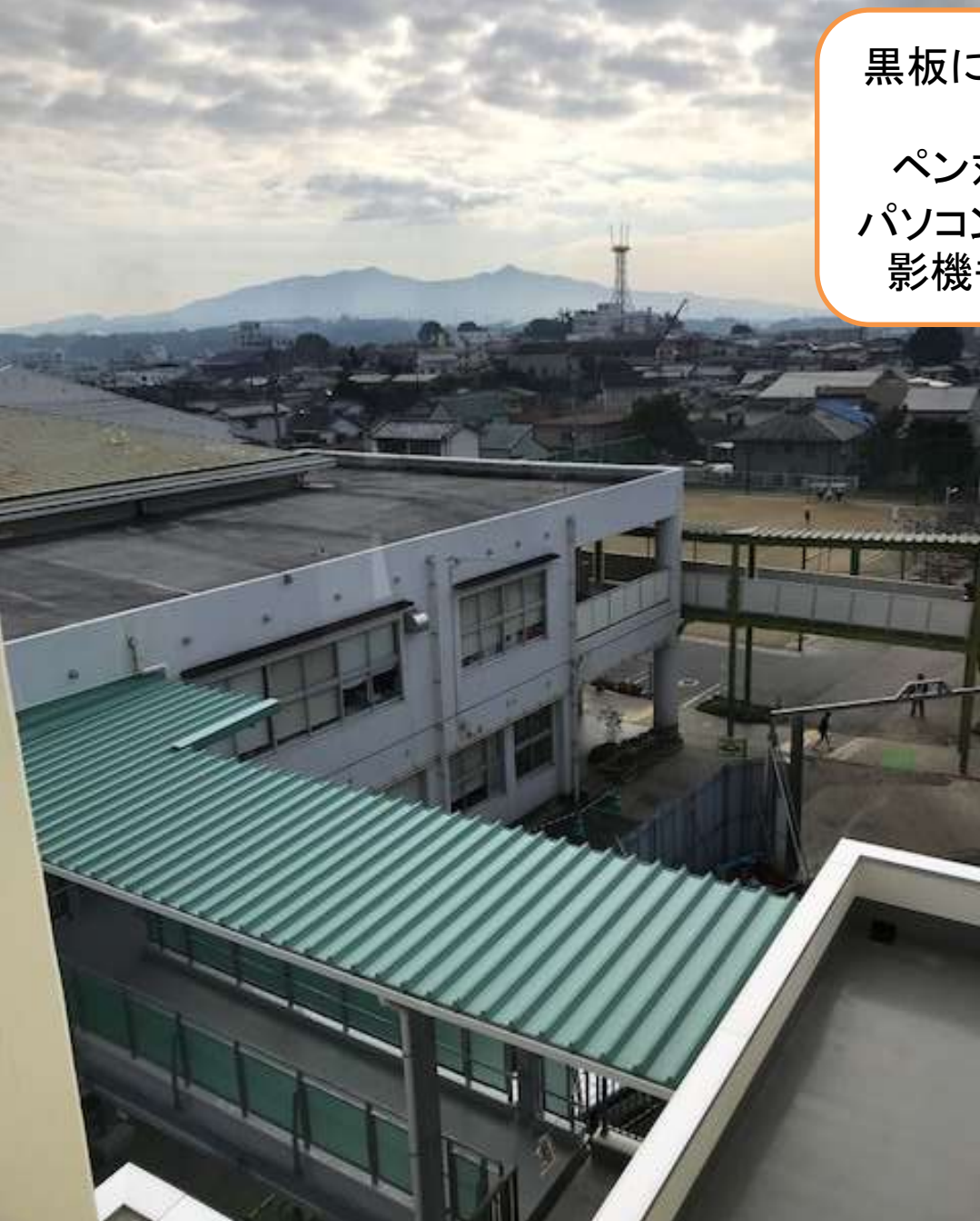
新校舎4階からの眺め

黒板に直接映し出すプロ ジェクター ペン対応もしています パソコンだけでなく実物投 影機もつなげられます