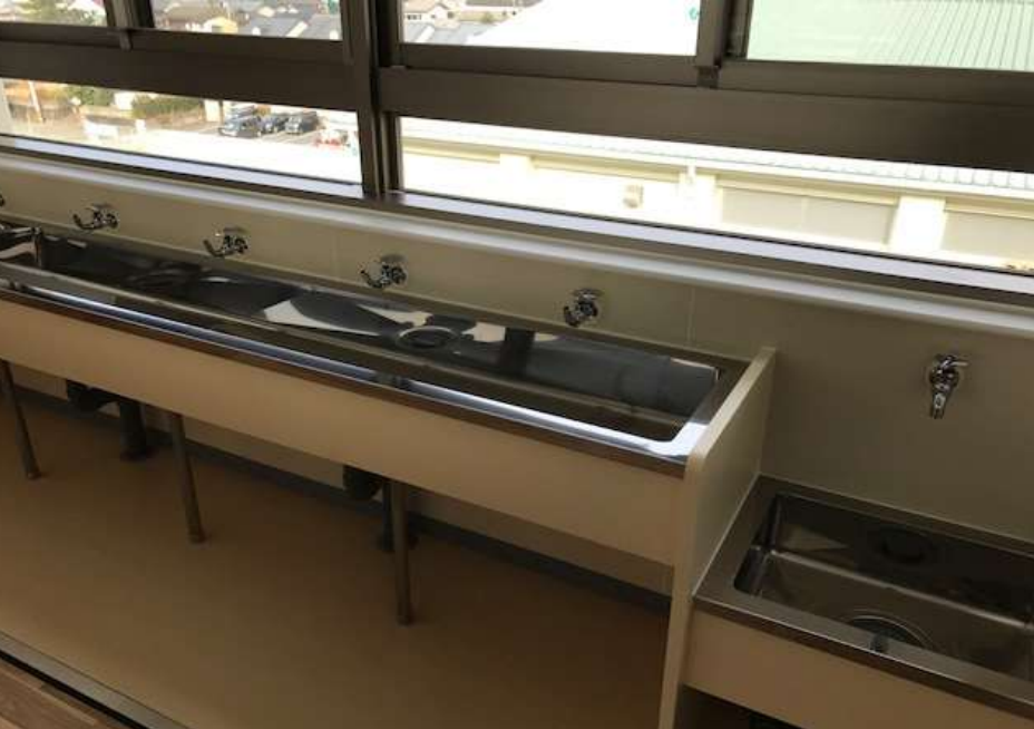
各教室前の手洗い場(右端バケツ用)