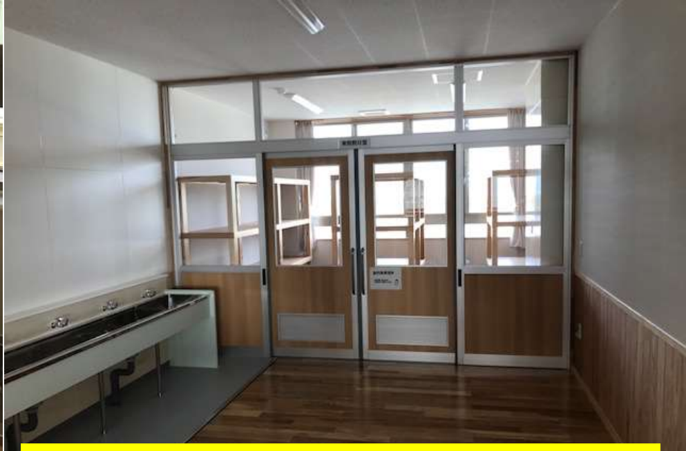
学年毎にある教材置き場