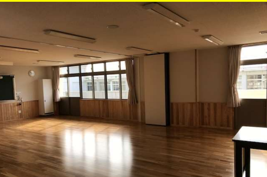
少人数教室(中央で区切ることが可能)