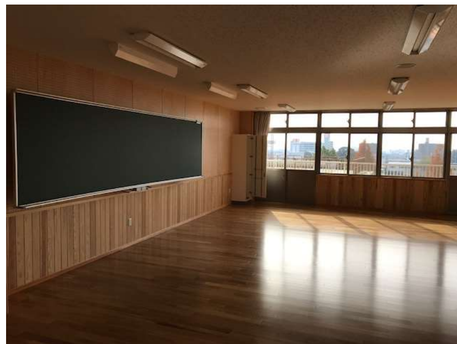
多目的に使用可能なトライルーム