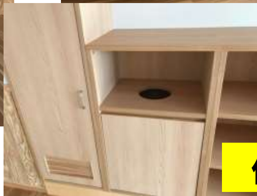
作り付けのゴミ箱