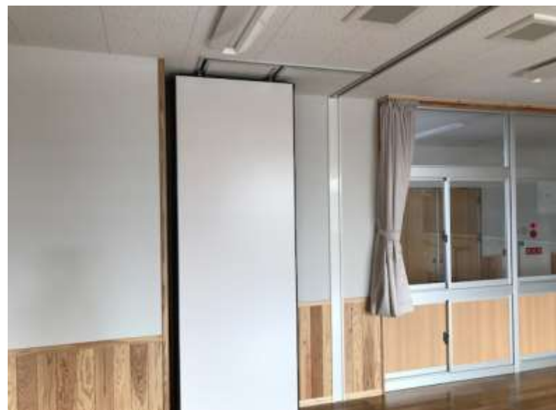
区切らないときは壁を収納