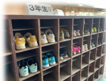
取組期間後もきちんとそろっています

黒っ子委員会の児童の取組として、先週までの2週間、靴箱の靴のかかとを揃える取組がありました。この取組を通して、子どもたちは靴を揃えることをしっかり意識し、最終結果では、3年生が見事グランプリを受賞しました。子どもたちの頑張りをたくさん褒めましたが、取組期間が終わった後も靴のかかとがきちんと揃っていたことを何よりうれしく思いました。(あ)