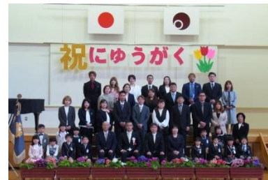
右上：本校入学式集合写真 左上：分校入学式 左下：本校入学式