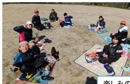
楽しみのお弁当タイム