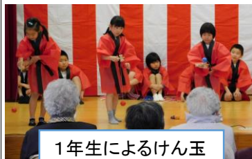
1年生によるけん玉

子供たちは、手作りのうさぎのお人形や折り紙、大きな松ぼっくりをいただきました。とても素敵な交流会で子供たちにとっても、楽しい時間でした。