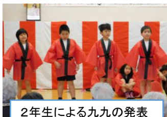
2年生による九九の発表