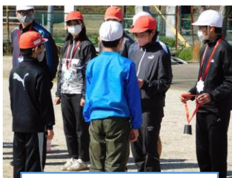
6年生からの表彰状