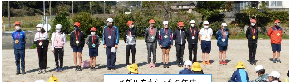
メダルをもらった6年生