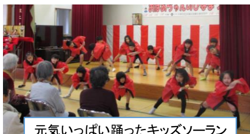
元気いっぱい踊ったキッズソーラン