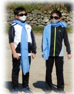
お祝いしたいんジャー

最後には自由時間がたっぷりあったので、6年生とのドッジボール対決もして、盛り上がりました。心に残る遠足になりました。