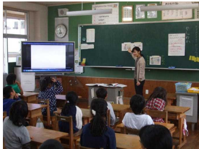
2年 主題名「正直・誠実」 資料名「やしゃわか」