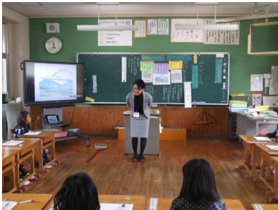
1年 主題名「なかよくたすけあおう」 資料名「やまのせいくらべ」

保護者の方々はもちろん、学校評議員や民生委員児童委員・主任児童委員の皆さんにも参観していただき、ありがとうございました。