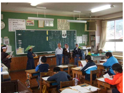
4年 主題名「尊敬・感謝」 資料名「白魚の来る川」