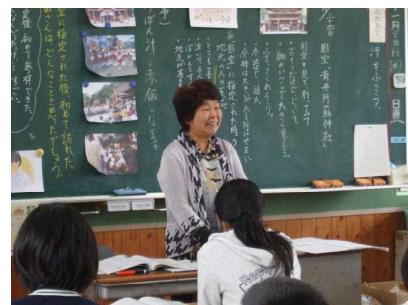
6年 主題名「郷土愛」 資料名「国宝『青井阿蘇神社』」