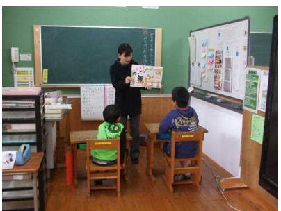
ひまわり 主題名「節度・節制」 資料名「とまってキッコくん」