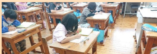
個人で家族を守る備えを考えている様子