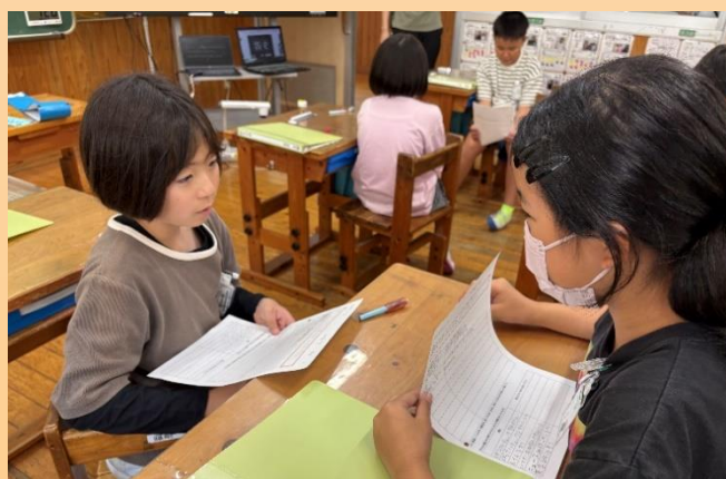
自分が考えた備えをペアで共有している様子

「それもあるね」や「忘れてた！」など、友達が考えた備えも参考にしながら付け加えていく。