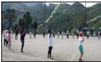
水俣ハイヤの様子