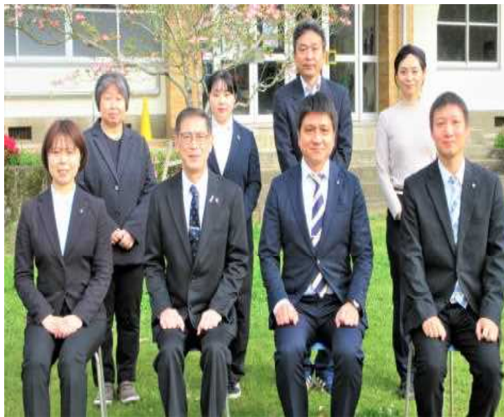
令和6年度・職員紹介

本年度も「確かな学力」「健やかな体」「豊かな心」を育て、児童の成長に向けて、地域の方々と連携し、様々な活動を行います。 本校では、児童の生活リズムを整え、学習意欲を高め、心身の健康を促すことを目指しています。