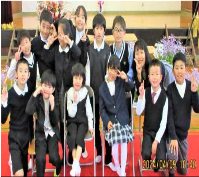
令和6年度・久木野小13名の子どもたち

本年度も「確かな学力」「健やかな体」「豊かな心」を育て、児童の成長に向けて、地域の方々と連携し、様々な活動を行います。 本校では、児童の生活リズムを整え、学習意欲を高め、心身の健康を促すことを目指しています。