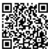
熊本県教育委員会H.P