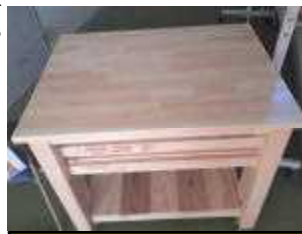
完成した給食配膳台

十月二十日(金)に水俣高校電気建築シ 作した訪問建築コースの生徒さん六名が製 作した給食配膳台の製作を行いました。計測 しながら組み立てていくことやインパクト ドリルを使うことなど、高校生ならではの 体験ができたと思います。