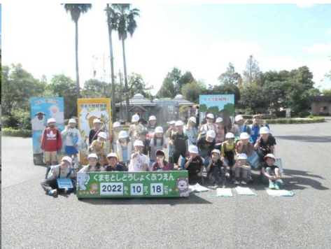
2年2組元気いっぱいピース

この日は、たくさんのお見学者がいたようです。子どもたちは、学校を離れ動物とふれあい、乗り物を楽しみ、元気に帰ってきました。