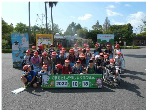
2年1組笑顔でピース