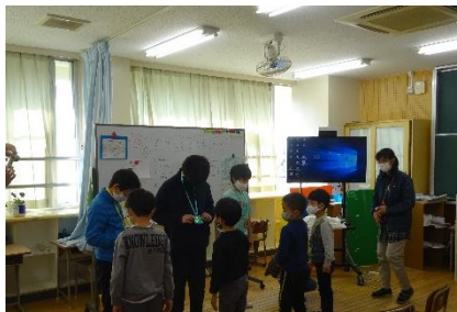
下級生が手作りのメダル等をプレゼントしました。