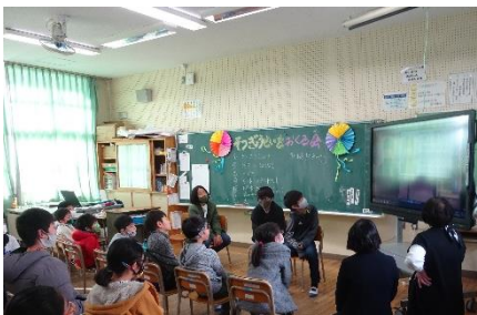
ビデオレターで自分の夢や決意を伝えることができました。

それぞれの学級で、卒業する6年生の思いを、事前に撮影したビデオレターを通して視聴した後、下級生から手作りのメダルやお祝いカードをプレゼントしたり、一緒にクイズやゲームを楽しんだりしました。「将来はイラストレーターになりたいです。」など、6年生一人一人が自分の夢や決意を発表する姿がとても頼もしく嬉しく感じられました。