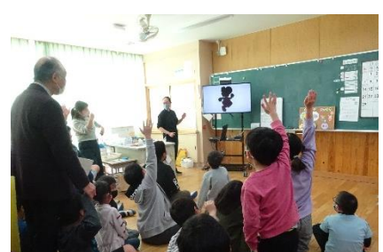
6年生と一緒にクイズ等を楽しみました。