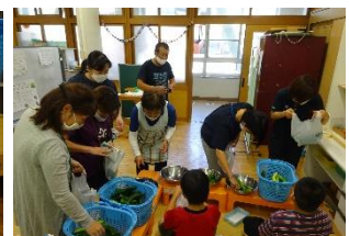
大盛況となった販売会