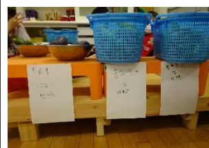
子どもたちが作成した値段表示

14日（月）に、たんぼぼ学級1-1組、5組の2年生が、収穫したばかりの新鮮な夏野菜の販売会を行いました。野菜を種類ごとに集めて並べ、なすび、きゅうり、ピーマン（3個）各10円等の値段表示も子どもたちが作成しました。収穫数が限られており、たんぼぼ関係職員を対象とした販売会となりましたが、子どもたちにとって達成感のある販売会となりました。