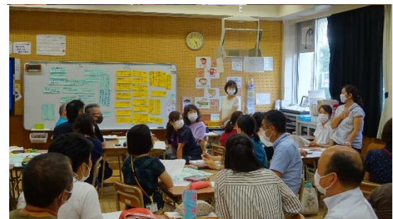
子どもたちの学びの様子をもとに協議しました。