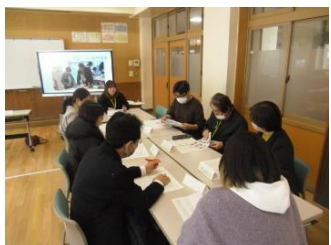
南っ子支援の会の様子