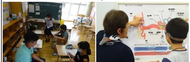
たんぼぼ1-2の公開授業の様子 たんぼぼ4の公開授業の様子

昨日、たんぼぼ学級の各教室で公開授業がありました。たんぼぼ1-2（5・6年生）では、ペアで話の聞き方等について学び合ったり、たんぼぼ4では、耳の構造等について学んだりするなど、それぞれの子どもたちの教育的ニーズに応じた指導の様子が見られました。他の職員も、たんぼぼ学級での子どもたちの学びの様子を熱心に参観していました。