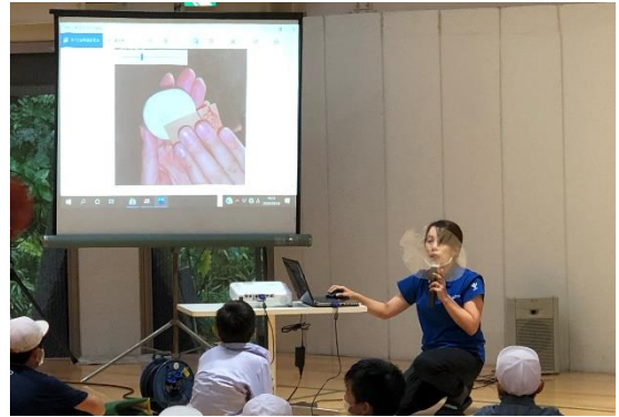
自然体験教室（雨天のため「流木ストラップ作り」を行いました。）

来週は修学旅行を予定しております。その実施に向けて9月25日(金)に事前説明会を開催し、6年生の保護者の皆様と、修学旅行前後と旅行中の感染防止対策について共通理解を図ったところです。予定どおり実施できますよう、本校でもしっかり準備を進めていきたいと思っております。