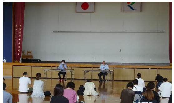
事前説明会（旅行担当者の方からも説明いただきました。）