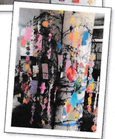
みんなの願い事、 叶いますように…

図書館前の天井には、折り紙で作った天の川が登場！委員会の折り紙達人が作った力作！お星様いっぱいできれいだったミン。スペシャルレアコダミンとして、「折り紙織姫・彦星コダミン」・「宇宙船コダミン」・「流れ星コダミン」などを飾ったミン。