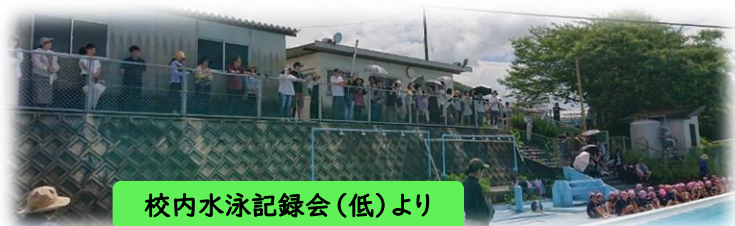
校内水泳記録会(低)より

昨年度の夏休みは25m泳げない子を集め、職員で力を合わせた3日間の水泳教室を実施しました。子供のがんばりと職員の指導で25mを泳げるようになり、感動的な水泳教室となりました。本年度も7月22日(月)、23日(火)、24日(水)の3日間実施の予定です。