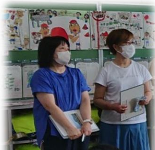
参観の学校評議員さん