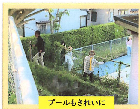
プールもきれいに