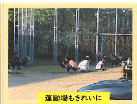
運動場もきれいに