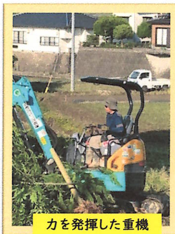
力を発揮した重機

改めて木葉小学校の保護者のパワーを感じました。その中心となってお世話をしてくれたPTA 役員さんに感謝の気持ちで一杯です。