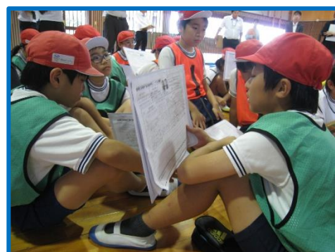
〈学習カード・ペア学習〉