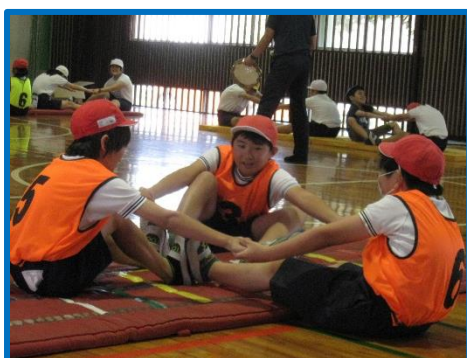
〈導入・スイッチオンタイム〉