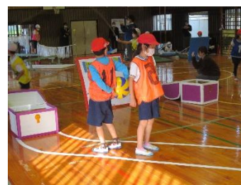
( 子 ども た ち の 活 動 の 様 子 )