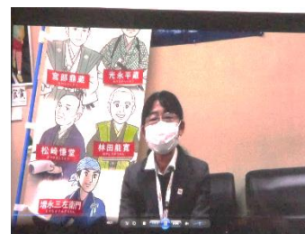
( 研 究 発 表 会 の 様 子 )