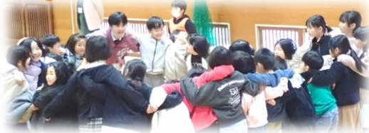
クラスみんなでドキドキドッジビー大会 ～目的～

子どもたちが自分たちの学校をもっとよりよくするために、様々な活動に取り組んでいます。