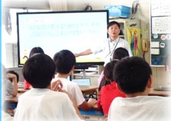
黒山スクールカウンセラー

6年生は、黒山SCから、 自分の感情との向き合い方 について役割演技等をして自己理解を深めました。