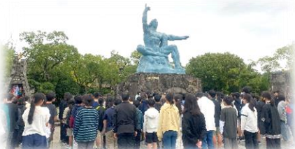
班に分かれてフィールドワーク