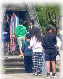
代表の子どもたちが千羽鶴を奉納

今年度も6年生の修学旅行で長崎を訪れました。これまで事前に学んでいたことを実際の地で感じることができ、平和の大切さについて深く考えた2日間となりました。特に平和公園で行った平和集会で「平和を作るのは私たち」と強く誓った子どもたちの姿は今でも私の心に深く残っています。修学旅行を通して、これからの生活の中で平和について考えること、身の回りのおかしなことに気づき、行動していくことが平和な未来をつくる第一歩であると改めて気づいた子どもたち。これからも学びを深めていきます。