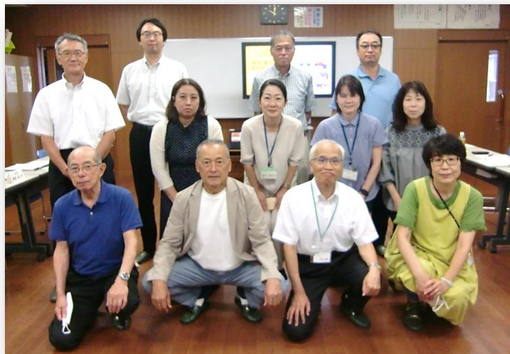
第1回の協議会開催前に出席いただいた委員の皆さまと

今年度も、学校と保護者と地域の皆さまとで、ともに知恵を出し合い、協働しながら子どもたちの豊かな成長を支え、「地域とともにある学校づくり」を進めていけるよう取り組んでいきます。