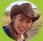
サイエンス・ コミュニケーター 恐竜くん