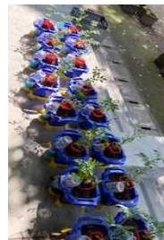
2年ペランダミニトマト