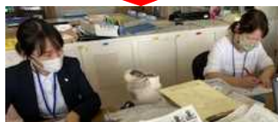
提出されたシートのチェック