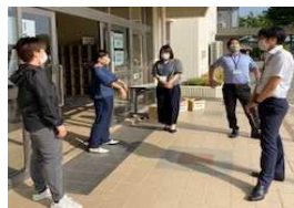
児童玄関前待機中の6年部