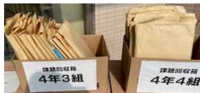
前回配付課題の提出

靴箱の場所がすぐ分かるように、掲示する、土足で上げられるよう新聞紙を床に敷く、受け渡し担当の当番学年を決めるなど事前準備をしました。いざ、受け渡しが始まると、先生たちの工夫が始まりました。「ミニトマトの苗は、やっぱり鉢にセットしておかなきゃ!」とか、「アサガオの植え方はHPにアップしてあります!」と貼り紙をしなきゃ!」とか・・・数時間おきに見に行くと、変化していきました。かがやき学級の畑もできましたよ!各学年部のチームワークも、日に日によくなっていきました。