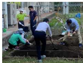
かがやき担任による畑作り