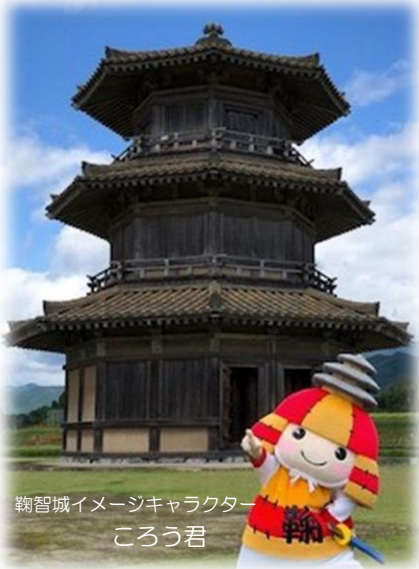
鞠智城イメージキャラクター ころう君

鞠智城は、今から約 1350 年前の飛鳥時代（665～667 年頃）に大和政権が国を守るために築いた古代山城の一つです。山鹿市と菊池市にまたがり、周囲 3.5 km、面積は 55ha にもなります。古代山城では国内初となる八角形建物の遺構や、歴史的に貴重な遺物が見つかり、復元建物や遺構表示など様々な形で公開しています。広い城内を散策するのにちょうどよい季節になってきました。今回は見どころの多い鞠智城の魅力の一部をご紹介します！