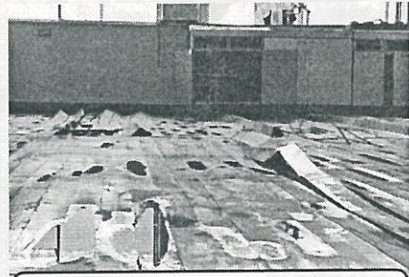
県立芦北高校(教室床の反り)