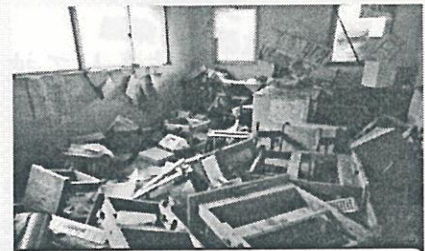
球磨村立渡小学校(浸水被害)