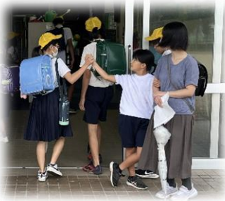
笑顔と結び目で始まる学校生活